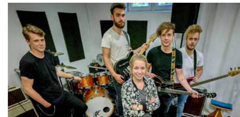
Die Band Lenna in ihrem durch Crowdfunding finanzierten Proberaum.

Dass es bei den Crowdfunding-Kampagnen durchaus auch um viel Schotter und Hightech-Projekte gehen kann, untermauert